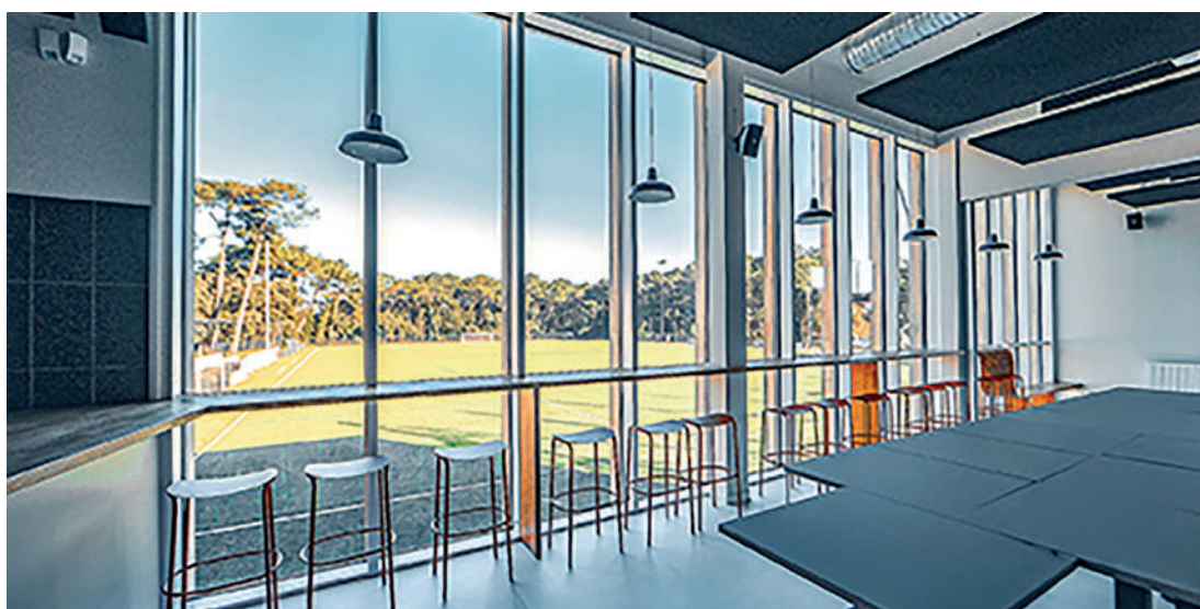
Un spacieux foyer avec vue plongeante sur le terrain, le fronton et les espaces boisés et complété d'une terrasse de plein air.