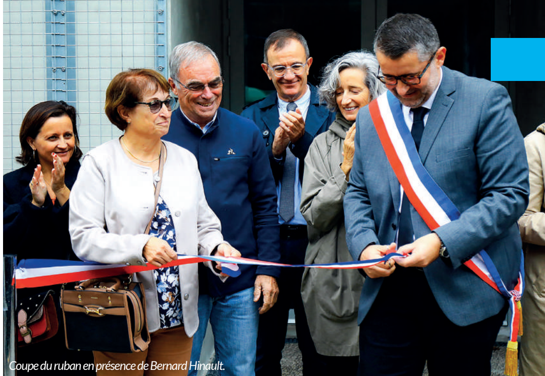
Coupe du ruban en présence de Bernard Hinault.