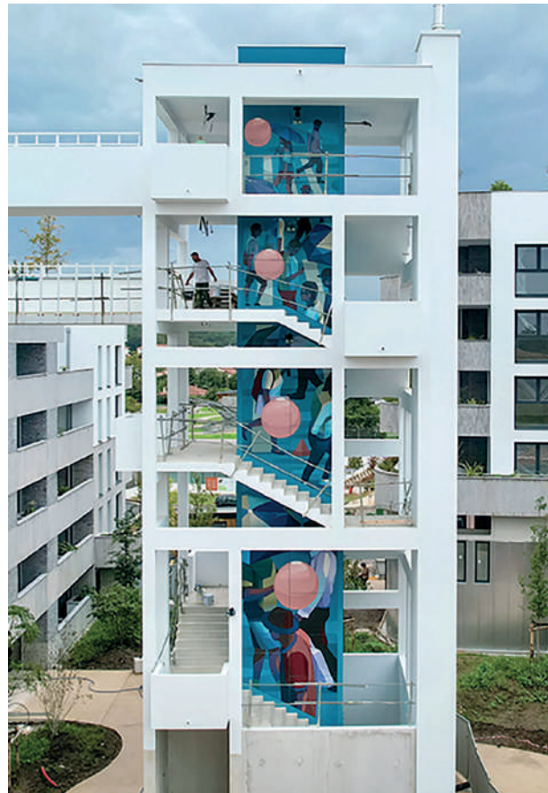
Portraits face sud de la tour