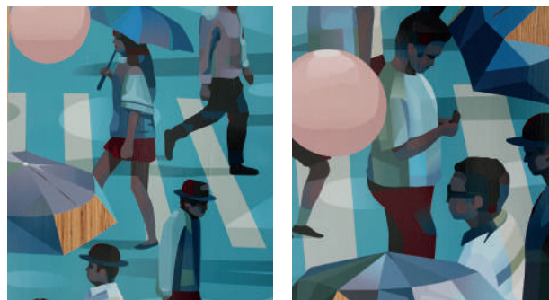
Face nord de la tour - thème de la mobilité