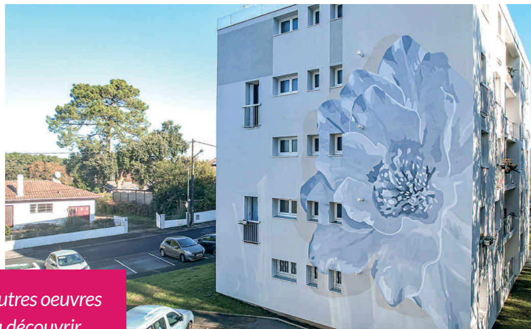
Fleur du Pissot

D'autres oeuvres à découvrir en page 13.