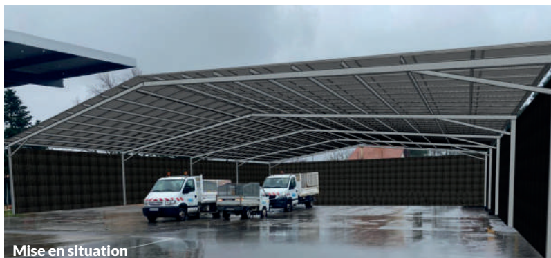
Mise en situation

En partenariat avec ENERLANDES, le Centre Technique Municipal va se doter d'un hangar de stationnement destiné aux services municipaux. Le toit du hangar sera couvert de 640 panneaux photovoltaïques pour une capacité de production de 281kWc / 297MWh/an.