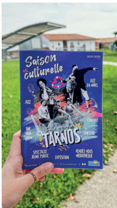
La plaquette culturelle 2024-2025 est disponible en ligne sur le site de la Ville ou à l'Hôtel-de-Ville.

Je tiens à remercier les associations tarnosiennes et leurs bénévoles pour cette mobilisation autour de cet événement Banský. Je le dis souvent mais nous avons la chance, à Tarnos, de bénéficier d'associations aussi nombreuses et actives dans leur rôle de cohésion sociale. Le street art, et la façon dont il pourrait se développer à Tarnos, est au cœur de nos réflexions. L'action culturelle se pense, se discute, s'affine avant de se concrétiser. Mais oui le street art va avoir sa place dans le paysage tarnosien, déjà riche et varié. Des projets sont en cours.