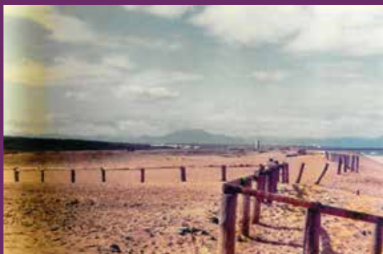
Ci-dessus : La Plage du Métro en 1984

En trente ans, Tarnos a beaucoup changé. Hans Pallor, ingénieur civil retraité, est impressionné par l'évolution du centre, attendant maintenant de pouvoir aller depuis le centre-ville jusqu'au magasin Carrefour sur des voies piétonnes. Pour son plus grand bonheur, la plage du Métro, elle, est restée naturelle, sans autre musique que celle de l'océan. La température de l'eau y est très « aimable » et le parking à l'ombre « extraordinaire ».