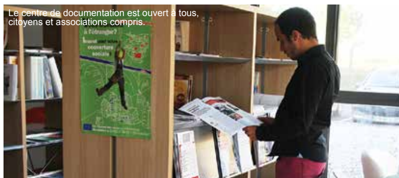
Le centre de documentation est ouvert à tous, citoyens et associations compris...

Au travers des acteurs de l'ESS, ce pôle est un véritable créateur de liens entre institutions, artisans, entreprises de toutes tailles et habitants du sud des Landes au sud du Pays Basque, en passant, de plus en plus, par le Béarn. Les coopérations se sont élargies, densifiées, ouvertes à de nouveaux thèmes et à de nouvelles missions communes. Répondant aux besoins des habitants et des entreprises locales, elles ont toujours, bien placés au cœur de toute réflexion, des objectifs d'intérêt général et d'innovation.