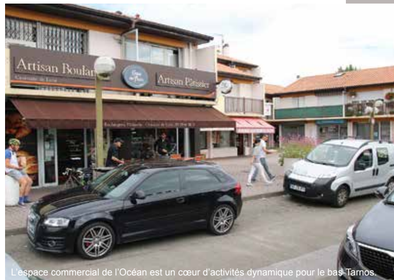
L'espace commercial de l'Océan est un cœur d'activités dynamique pour le bas-Tarnos.

De la même façon, nous encourageons les maraîchers tarnosiens qui ont fait le choix de vendre leurs produits à la ferme ; les consommateurs ne s'y trompent pas et adoptent l'achat de proximité.