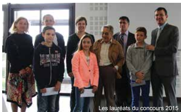
Les lauréats du concours 2015

Le concours de prose 2015, intitulé « Travail de mémoire » pour les élèves tarnosiens de cycle 3 a livré son verdict : la coopérative scolaire Félix Concaret se voit attribuer une subvention de 300 €.