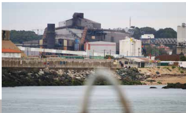
Celsa, ex-ADA, envisage la création d'un nouveau laminoir avec 220 emplois à la clé.