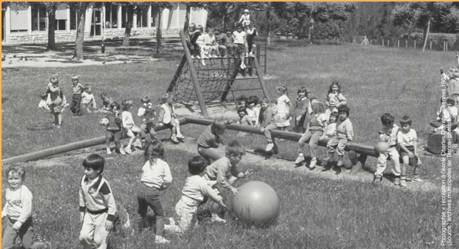
Photographie « récréation à l'école Charles Durroty », années 1980