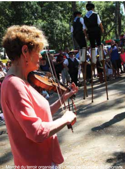
Marché du terroir organisé par l'Office de Tourisme du Seignanx