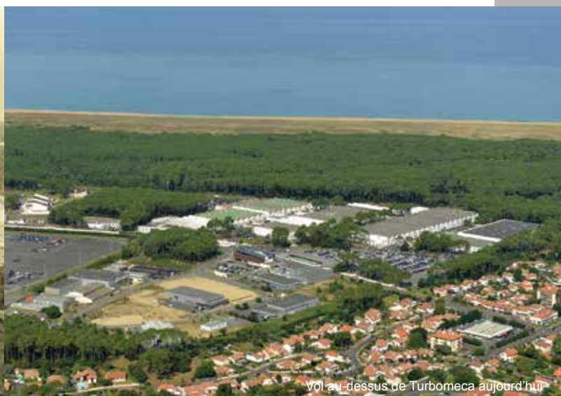
Vol au-dessus de Turbomeca aujourd'hui