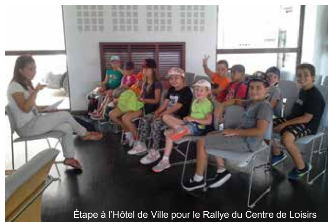
Étape à l'Hôtel de Ville pour le Rallye du Centre de Loisirs

La journée « Métro Session » a une nouvelle fois était une réussite ! Avec ses ateliers de sensibilisation au respect de l'environnement, aux risques du soleil et de l'océan, ses activités sportives et culturelles, elle s'inscrit désormais comme un rendez-vous incontournable pour les jeunes en début d'été !