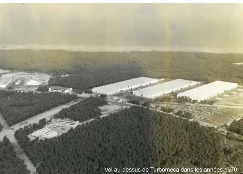
Vol au-dessus de Turbomeca dans les années 1970