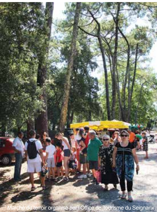
Marché du terroir organisé par l'Office de Tourisme du Seignanx