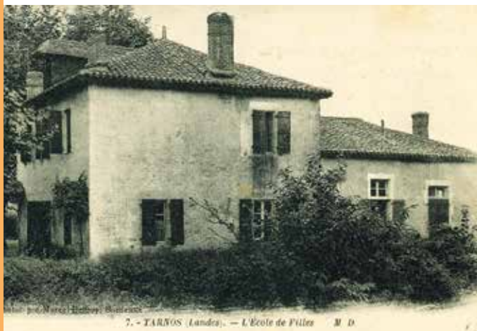
Photographie de l'école des filles du bourg (à l'emplacement actuel de la salle Henri Duga), première moitié du XX e siècle.

Au cours du XX e siècle, plusieurs nouveaux établissements scolaires sont construits : le groupe scolaire Jean Jaurès en 1938, l'école maternelle Charles Durroty en 1956, l'école Odette Duboy en 1972, ou encore la nouvelle école Jean Mouchet en 1978, et l'école Félix Concaret, inaugurée en 1986. Face à l'augmentation de la population, les années 2000 sont également marquées par la construction de deux établissements publics supplémentaires, les écoles Robert Lasplacettes et Daniel Poueymidou. Le nombre d'élèves scolarisés en 2015 s'élève à 1113.