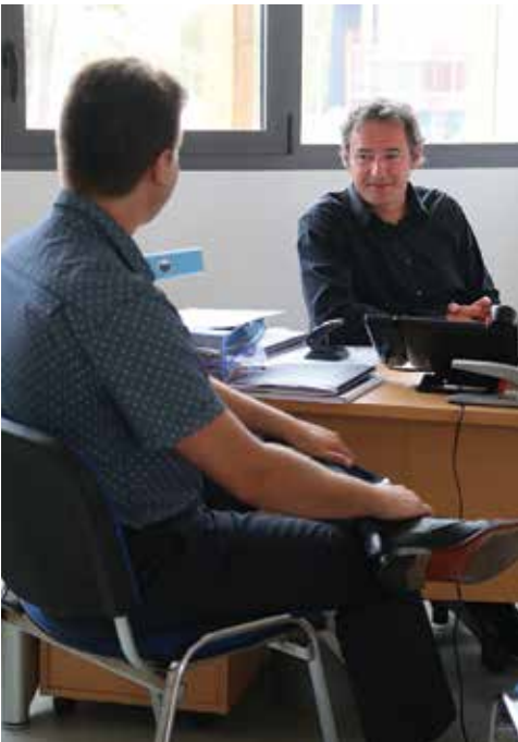
L'union régionale des coopératives d'Aquitaine est installée à Tarnos, au sein du Pôle de coopération.