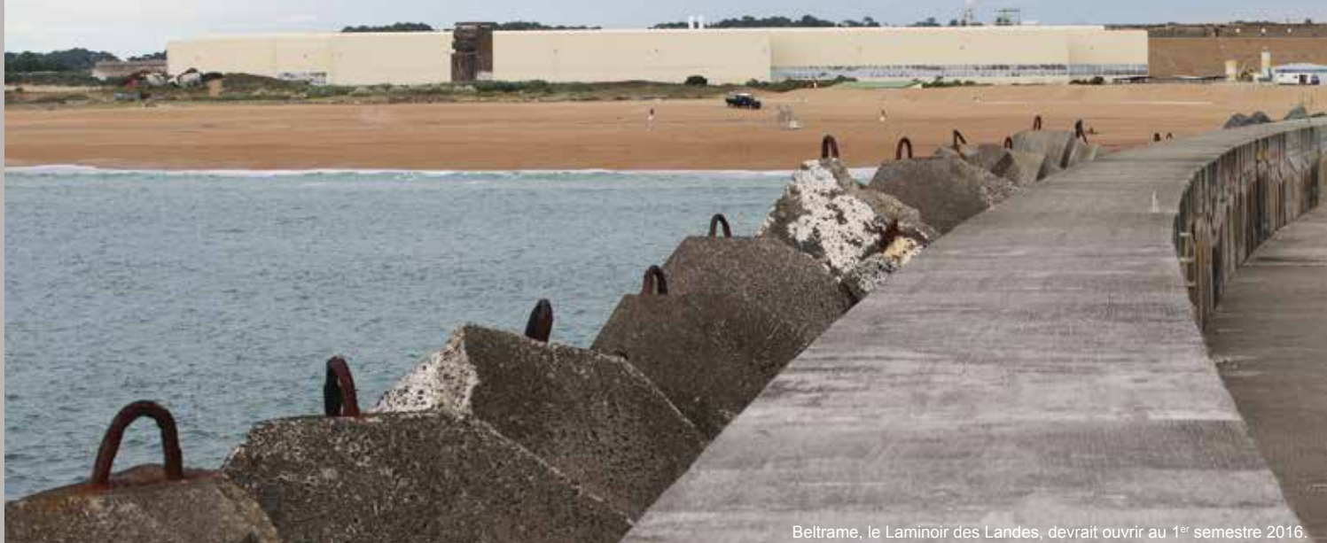
Beltrame, le Laminoir des Landes, devrait ouvrir au 1 er semestre 2016.