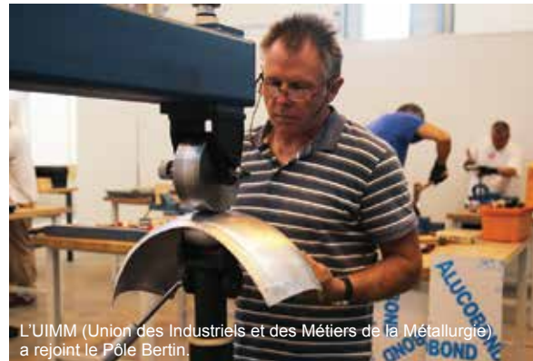
L'UIMM (Union des Industriels et des Métiers de la Métallurgie) a rejoint le Pôle Bertin.

adultes de tout âge. On pense notamment au PERF, au PLIE, ou encore à l'UIMM.