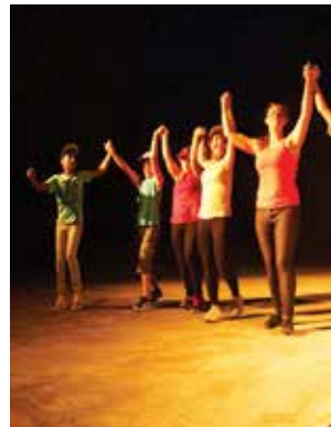
Soirée de fin d'été des jeunes