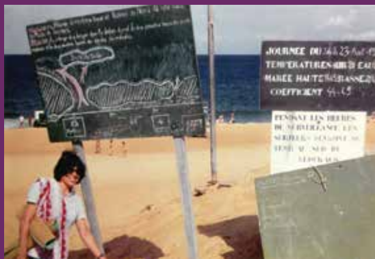
Ci-dessus : Gerda Pallor devant les panneaux de la plage du Métro en 1984.